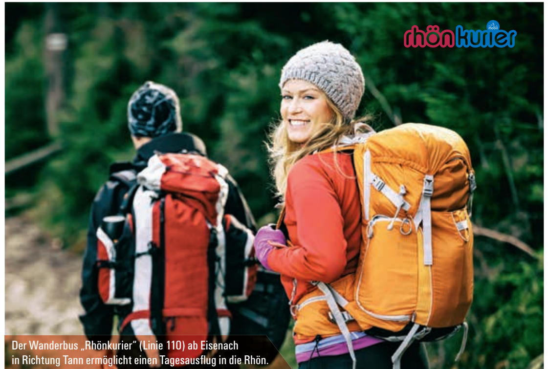
Der Wanderbus „Rhönkurier“ (Linie 110) ab Eisenach in Richtung Tann ermöglicht einen Tagesausflug in die Rhön.

Die bisherige Verbindung von Bad Salzungen nach Vacha wird bis Bad Hersfeld verlängert und verkehrt im Stundentakt. In Bad Hersfeld besteht alle zwei Stunden Anschluss an den ICE nach Frankfurt/Main. In Eisenach ist ebenfalls der Umstieg in den ICE nach Frankfurt/Main bzw. nach Erfurt – Leipzig/Halle – Berlin möglich. Der Bahnhof Eisenach befindet sich